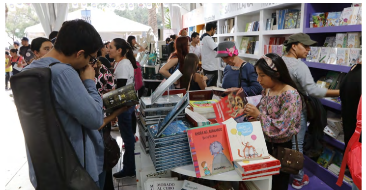
Aspectos de la pasada Feria Internacional del Libro Infantil y Juvenil, en el Cenart.

Pero Bergna, premiada en la Feria de Bolonia, observa ventajas: si en años pasados la FILIJ se centraba en la Ciudad de México, esta vez con el esquema virtual alcanzará a todo el país.