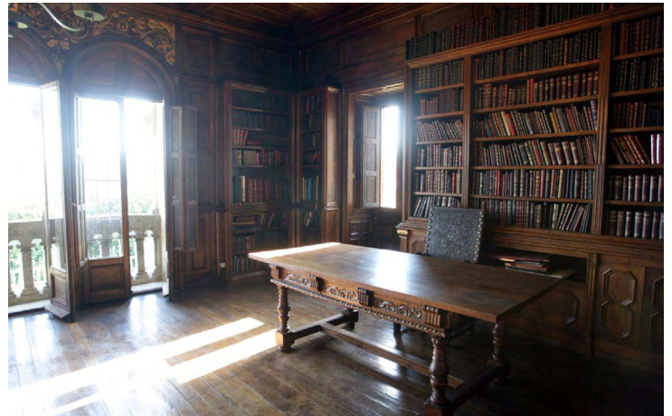
Biblioteca de Pardo Bazán en la Torre de la Quimera del Pazo de Meirás.